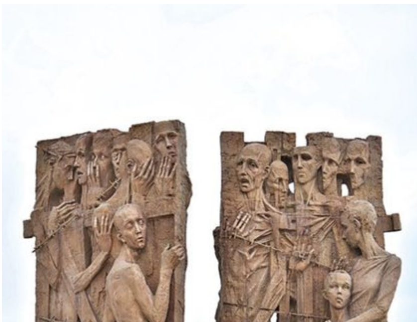
Историки продолжают изучать трагедию концлагеря "Трошенец"