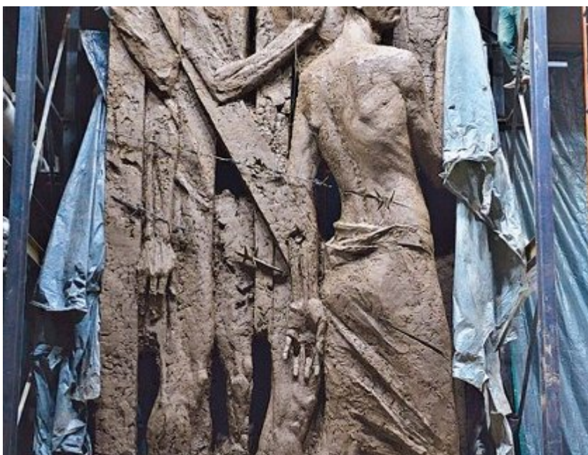
9 мая 2015 года откроется мемориальный комплекс "Трошенец"